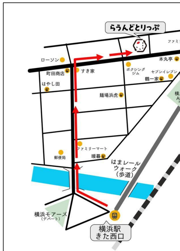
きた西口から 地上(鶴屋町)を進むルート