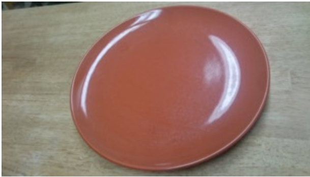
丸い大皿(27 cm ✕ 27 cm) 3枚