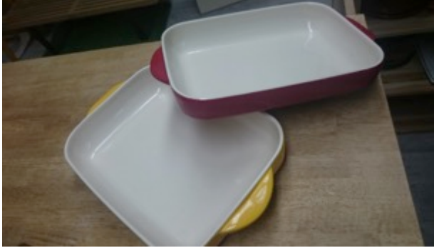
耐熱皿(26 cm ✕ 20 cm) 3枚