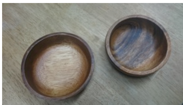
木製深皿(12 cm ✕ 12 cm) 8枚