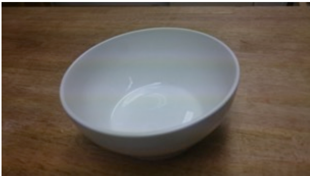
深取り皿(15 cm ✕ 15 cm) 11枚