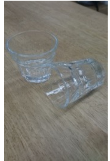
(14 cm ✕ 8 cm) 6個