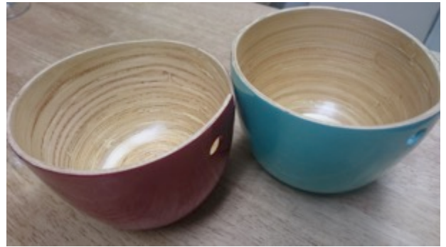
深皿小(14 cm ✕ 14 cm) 2枚