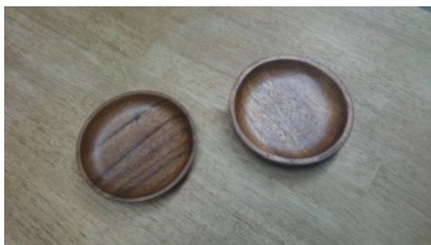
木製皿小(10 cm ✕ 10 cm) 4枚