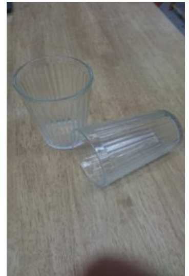
(12 cm ✕ 7 cm) 3個