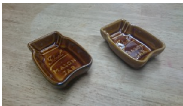
ディップ皿(6 cm ✕ 4.5 cm) 3枚