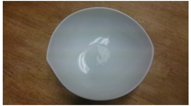
深皿(21 cm ✕ 19 cm) 2枚