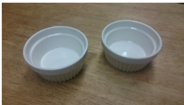
ディップ皿(8 cm ✕ 8 cm) 5枚