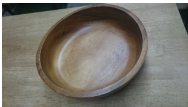
木製大皿(25 cm ✕ 25 cm) 2枚