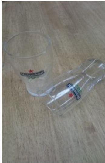
(11 cm ✕ 8 cm) 4個