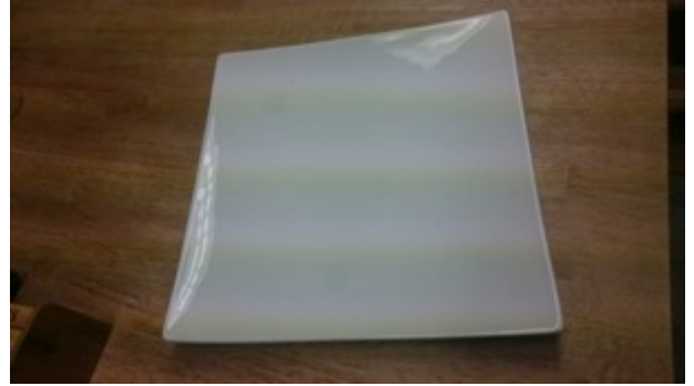
四角い大皿(28 cm ✕ 28 cm) 2枚