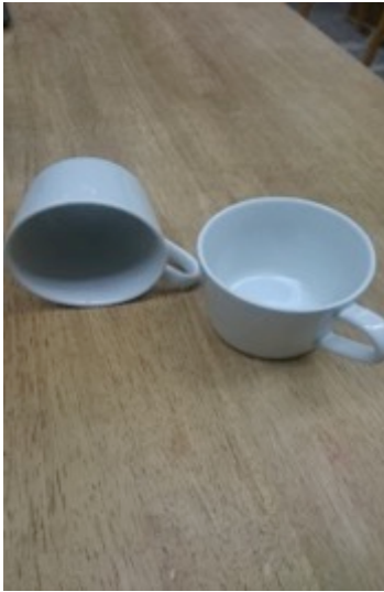
(9.5 cm ✕ 7.5 cm) 8個