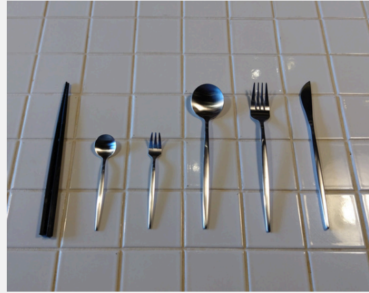
箸、ナイフ、スプーン、フォーク 各6セット