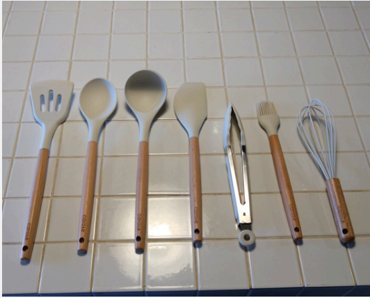
フライ返し、スプーン、おたま、へら、トンダ ハケ、泡立て器