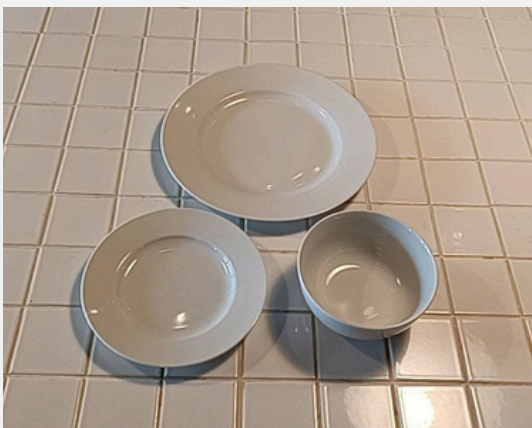
平皿26cm・19.5cm、お椀14cm 各6枚ずつ