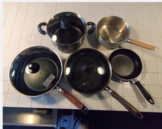
フライパン20cm浅型・26cm浅型・28cm深型 片手鍋20cm、両手鍋22cm