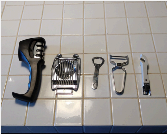
包丁砥、スライサー、栓抜き、ピーラー、缶切