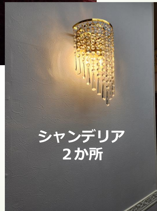
シャンデリア 2か所