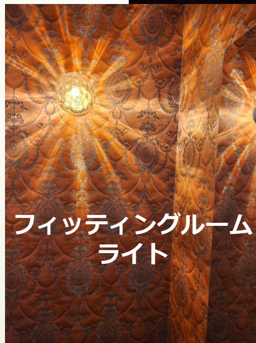
フィットニングルーム ライト