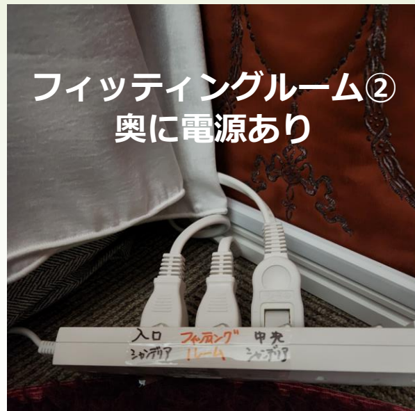
フィットニングルーム② 奥に電源あり