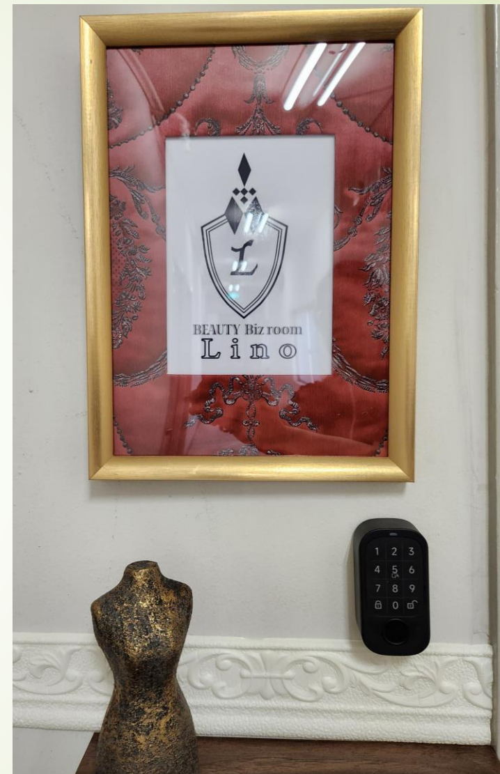
入り口 ドア横設置