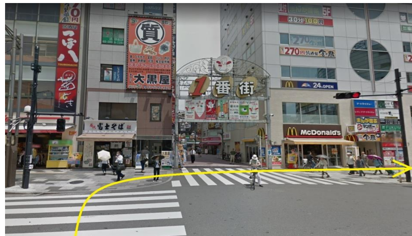
② 横断歩道を渡って、右折してマクドナルドの方に進む