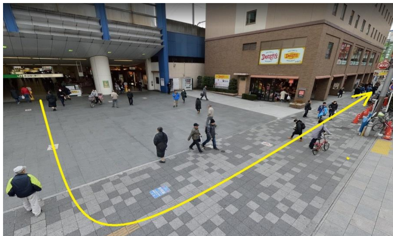
① 赤羽駅東口を出て、左へ進む