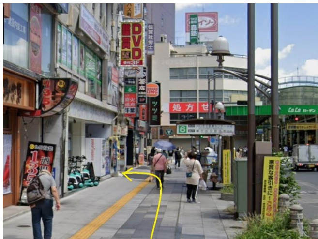
③ 真っ直ぐ進んでバス停を越えたら左手に入口です