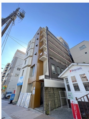
スペースの外観写真 ※大黒不動産 右横の 階段からはいります。