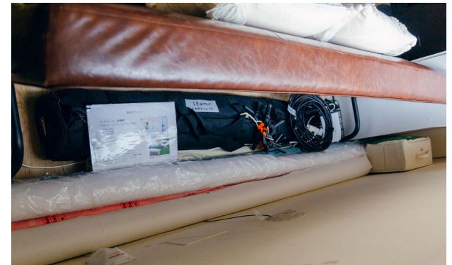
※背景紙・スタンドはソファ裏にあります