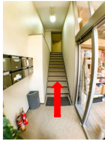
階段を上がると M2 階です