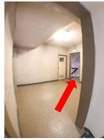
M2 階のホールを進み