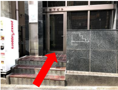
六本木通り側のビル正面から入り