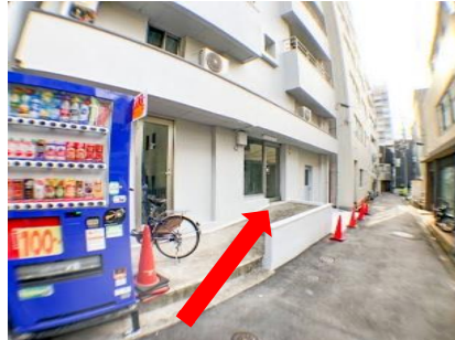
自販機横のスロープを上がると 1 階です