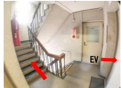
左手の階段か右手の EV で 2 階へ

※夜遅い時間や休日は正面が施錠されている場合があります。その場合は、ご足労ですがビルの裏口へお回りください