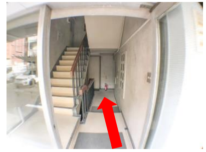
奥の EV で 2 階へ

内側からビル正面のカギを開錠してもかまいません。開錠したらそのままにしておいてください。