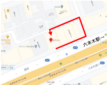
裏へお回りください

※夜遅い時間や休日は正面が施錠されている場合があります。その場合は、ご足労ですがビルの裏口へお回りください