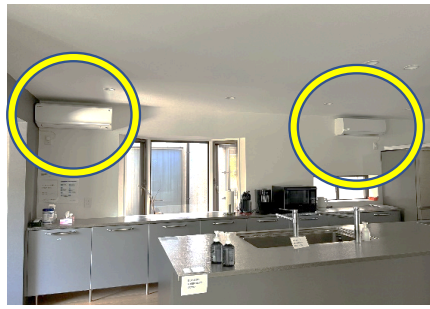
キッチン(エアコン)