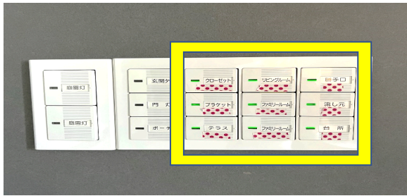
キッチン横勝手口(黄枠 電気スイッチは緑)