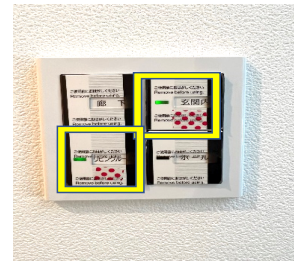
玄関横(黄枠 電気スイッチは緑)