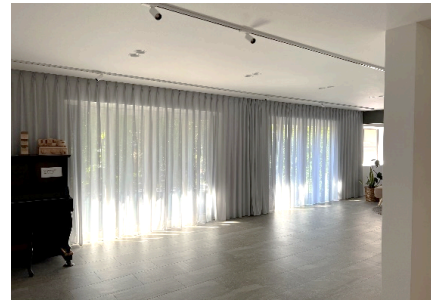
1階ホール(カーテン)