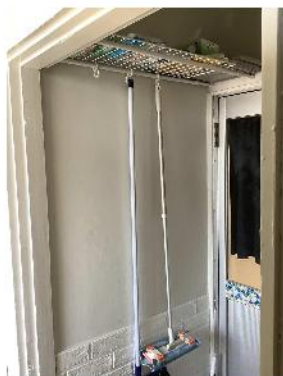
女性用トイレ前 上の棚にはクイックルワイ パーのシート等があります。