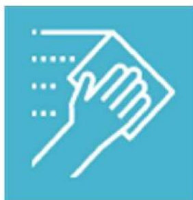
【設備/備品/鏡】 ご使用後は雑巾やウエ ットティッシュで必ず 拭いてください