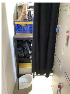
ロッカー横の倉庫 塵取りが置いてあります。