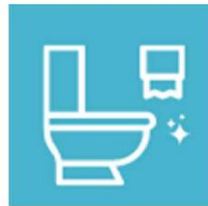
【トイレ】 汚した場合は必ず掃除を してください