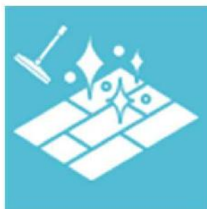
【床】 ほうき、クイックル ワイパーで掃除して ください