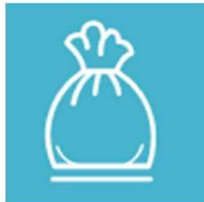
【ゴミ】 必ずお持ち帰りください