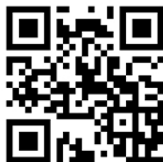
スペースマーケット