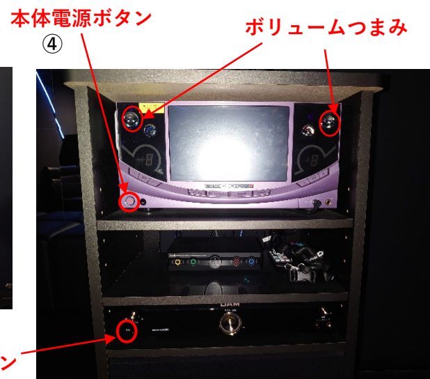
アンプ電源ボタン