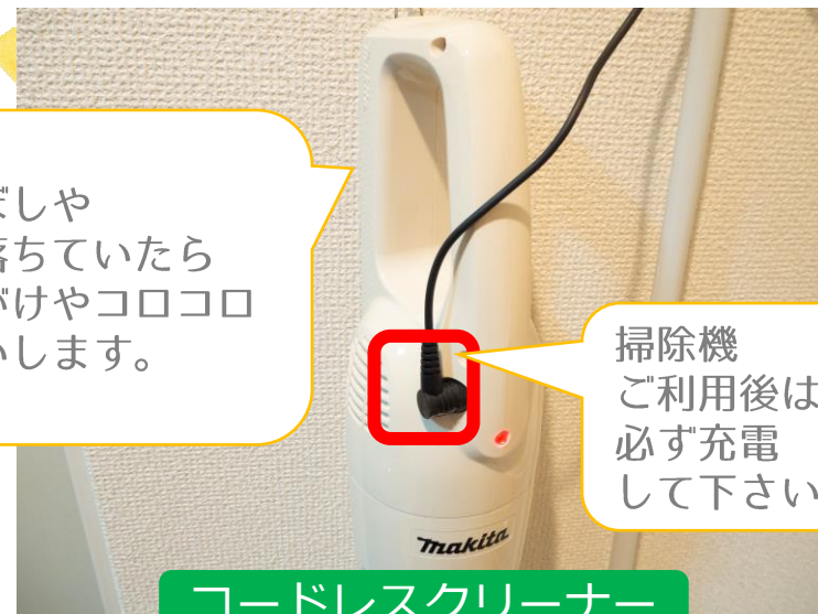
コードレスクリーナー